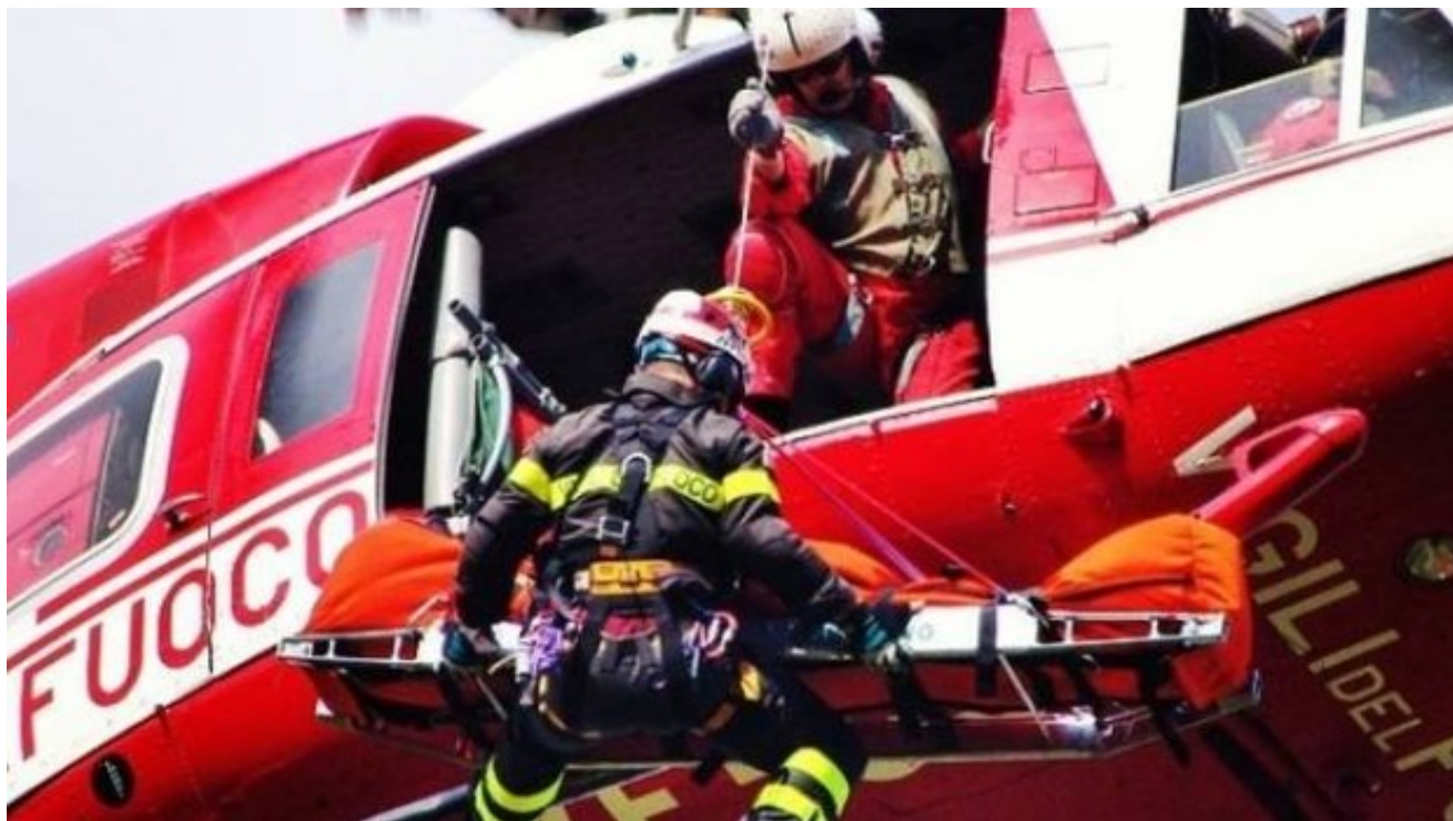
Elicottero dei vigili del fuoco