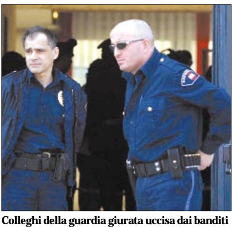
Colleghi della guardia giurata uccisa dai banditi

Il Savip, il Sindacato autonomo vigilanza privata, prende posizione sull'omicidio e, con riferimento a tutta Italia, parla di «39/vittime in 10 anni». «Speriamo che, al di là delle solite espressioni di cordoglio formale delle autorità, l'ennesimo, barbaro omicidio di una guardia giurata - sottolinea il Savip - provochi un reale intervento da parte dei respon-