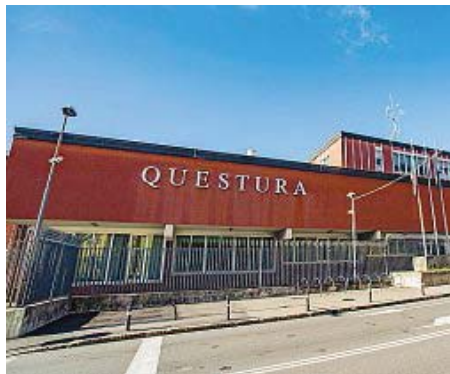
Via Noli La questura era stata realizzata prevedendo alloggi per alcuni dirigenti