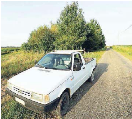
Il punto della mancata sparatoria con Igor, a Consandolo

è stato aperto dall'ufficio giudiziario militare guidato dal procuratore Stanislao Saeli, sulla base delle notizie riportate dai giornali usciti sulla vicenda. L'obiettivo dell'accertamento dei magistrati militari, ancora in corso, è quello di approfondire cosa sia successo quella sera e se vi siano eventuali responsabilità in chi ha operato - i tre carabinieri - al momento, comunemente, non ipotizzate.