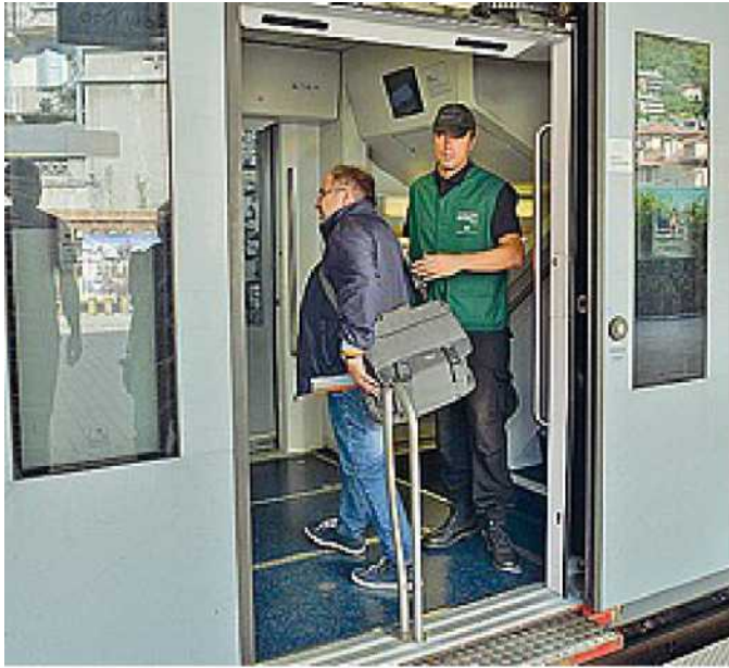
In vettura Un vigilantes del «Security team» creato da Regione e Trenord